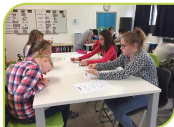
Project: werken in team.

Voor meer info kan je terecht op onze website www.atheneum-herzele.be