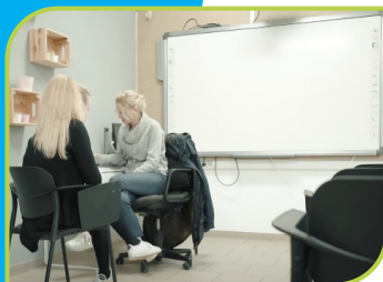
In de instructieruimte.