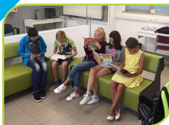
Project: LIST = Lezen is tof.