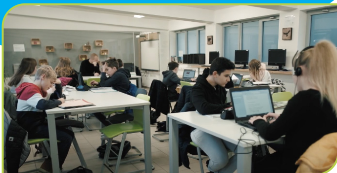
De klassetting: individueel werken met pc, tablet. Ondertussen zijn anderen aan het werk in de leeshoek of in de instructieruimte.

Door de speciale klassetting krijgt men een klas in beweging. De leerlingen vliedert doorheen de klas van computer naar zithoek, van zithoek naar instructieruimte, van instructieruimte naar verbeter tafel. Klaswissels vervallen waardoor de leertijd hoger ligt.