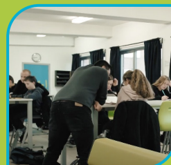
Begeleiding tijdens de algemene vorming.

“Op deze school zijn ze super goed bezig. Je krijgt hier weekplanningen die je zelfstandig mag maken op jouw eigen tempo. Je kiest zelf met welk vak je begint, maar je moet wel alle vakken gemaakt hebben op het einde van de week. Ik droom er van om later met kinderen te werken!”